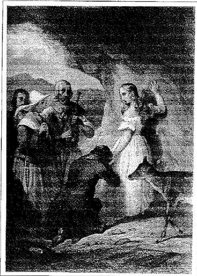
La grotte Jocelyn (Bussières): lithographie tirée d'une des éditions du roman de Lamartine (1836) (article page 23)